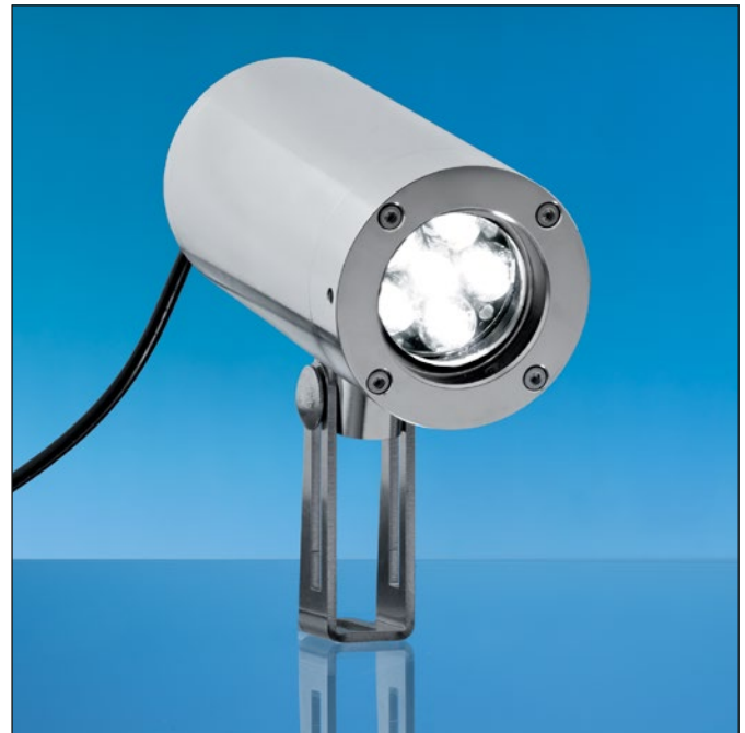
Lumistar Leuchte ESL55LED-Ex